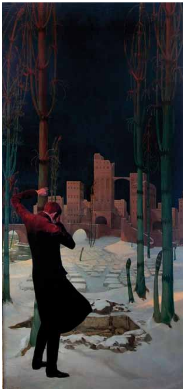
Gudmund Hentze: »Pesten i Bergamo«. Olie på lærred, 188×89 cm.