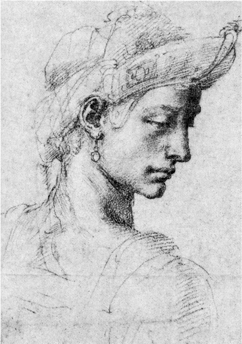
Michelangelo (1475-1564): Kvindeprofil